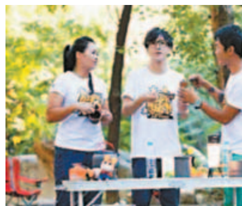
薛之谦(中)户外做饭。

手薛之谦从延庆出发，一路以徒步形式体验户外运动，搭帐篷、野外做饭、户外做咖啡等互动环节让薛之谦激动不已，并最终